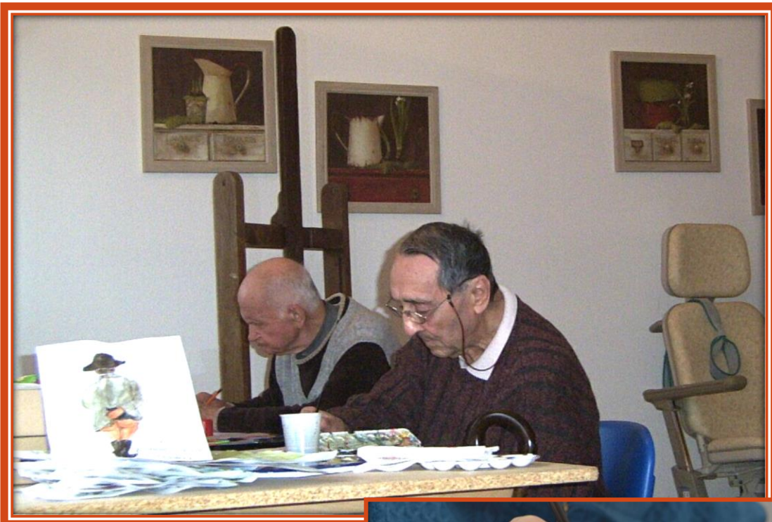
Une vue de l'artiste : Napoléon « cul nu »